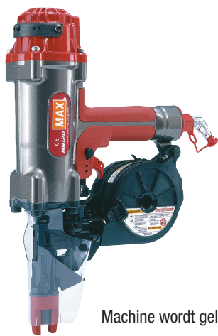
Machine wordt geleverd in koffer