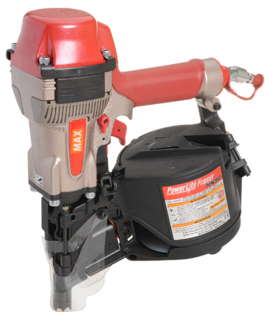
Machine wordt geleverd in koffer