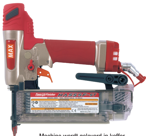
Machine wordt geleverd in koffer