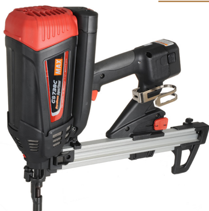
Machine wordt geleverd in koffer Incl. 2 accu's en lader