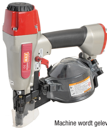
Machine wordt geleverd in koffer