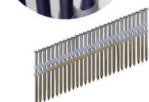
Roundhead nagels op strip 21°