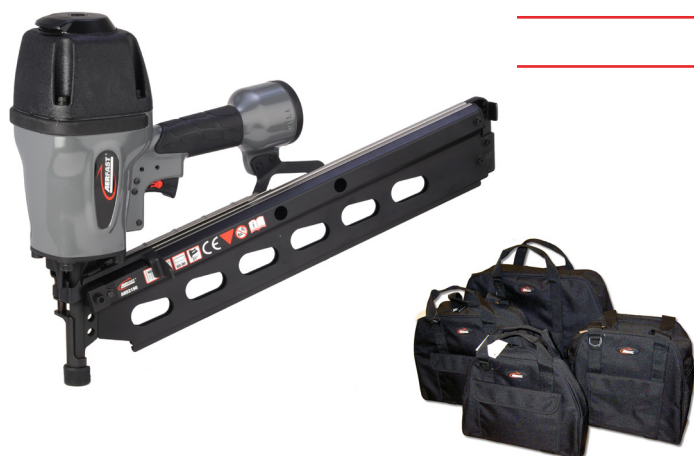
Machine wordt geleverd in canvas tas