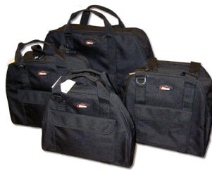
Machine wordt geleverd in canvas tas