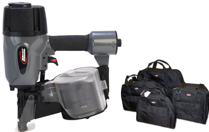
Machine wordt geleverd in canvas tas